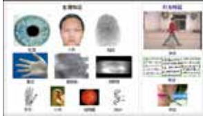
Overview of biometrics research (P1254)