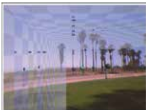
Review of depth perception in virtual and real fusion environment (P1503)