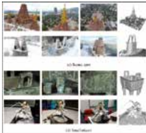
Progress in the large-scale outdoor image 3D reconstruction (P1429)