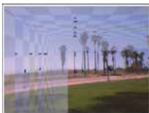
虚实融合场景中的深度感知 研究综述(第1503页)