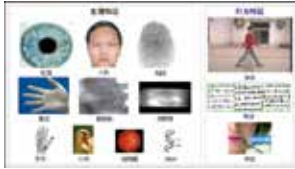
生物特征识别学科发展报告 (第1254页)